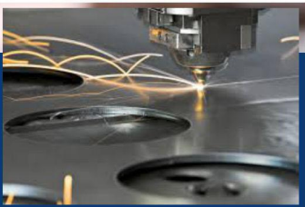
FABRICACIÓN DE PIEZAS